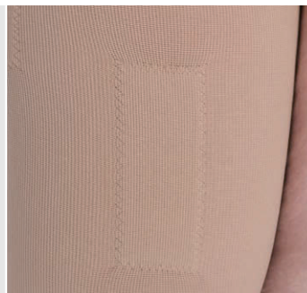
シリコンストッパー