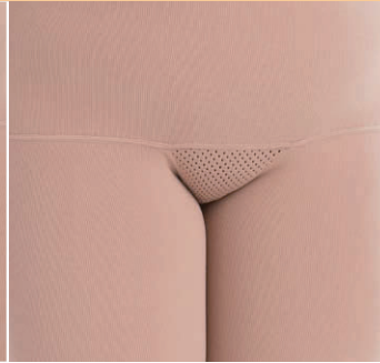
メッシュガゼット