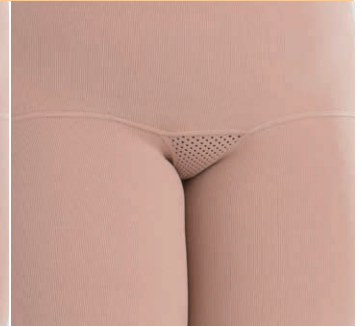
小さいメッシュガゼット