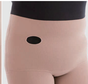
ストーマ用開口部加工