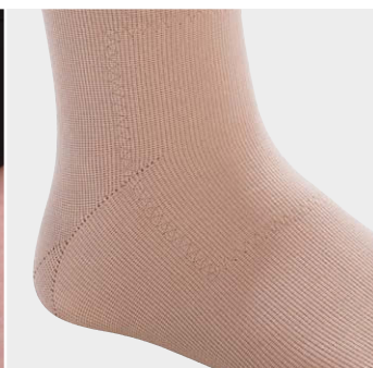
cY点にトリコット裏地

・オーバーハイトとの併用のみで可 ・生地内側3/4のみ縫い込みも可能 ・その上に別のシリコンすべり止めを付けることもできる