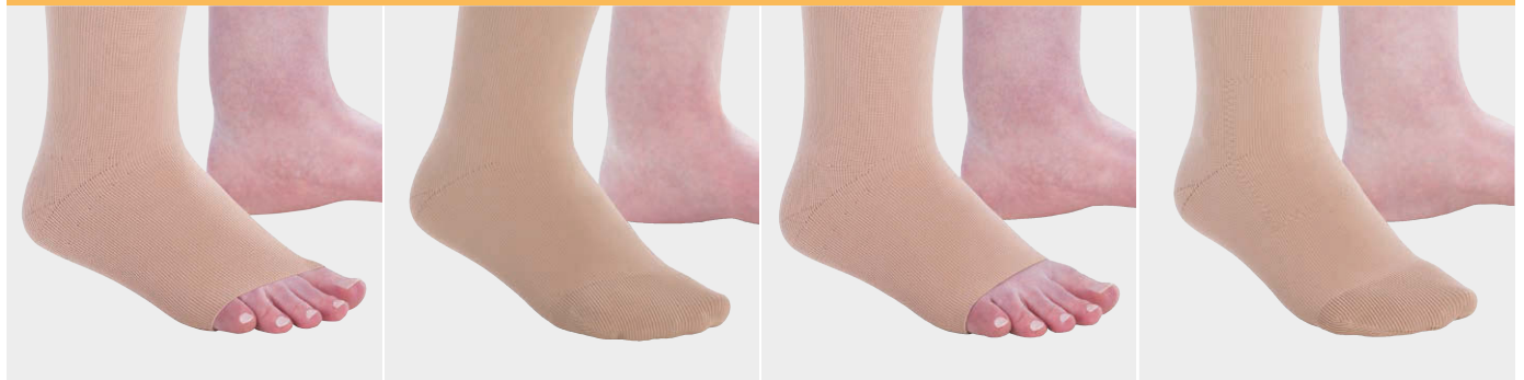
足先斜め加工のつま先なしタイプ 足先斜め先のつま先ありタイプ つま先なしタイプ つま先ありタイプ