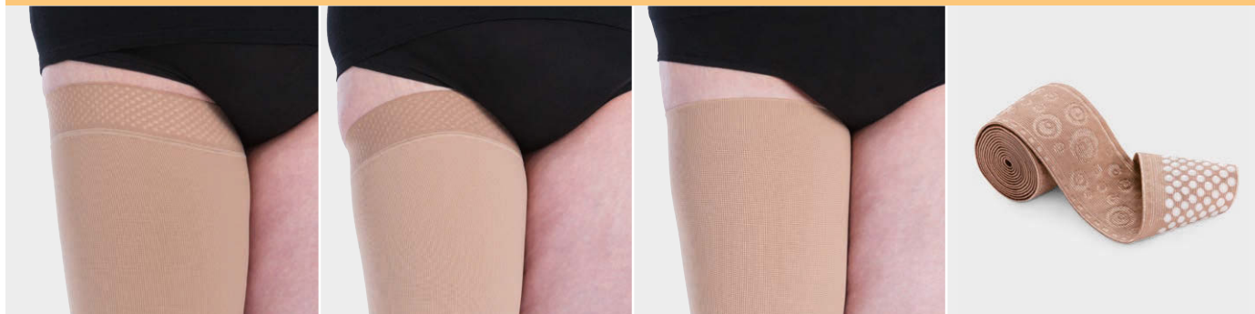
外側オーバーハイト／マックス