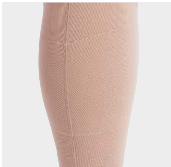
パッド用ポケット

・内果外果後部により圧迫が必要な場合 ・皮膚炎が見られる場合はシルバー入りのパッドもあります ・シリコン製パッドもあります