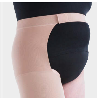
ベルト付き片脚ストッキング