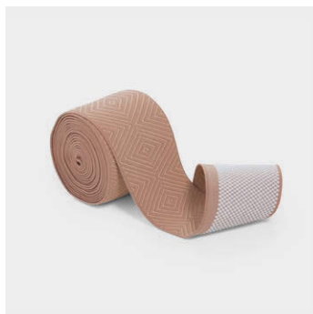
マイクロシリコンすべり止め 5 cm マイクロシリコンすべり止め柄入り 5 cm