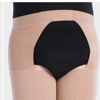
ベルト付き片脚ストッキング(ペア)