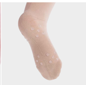
シリコン付き足底