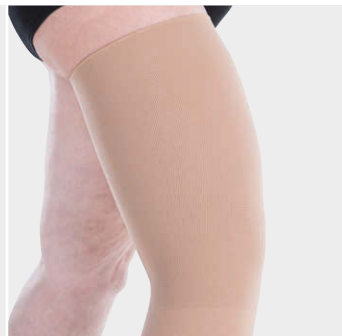
cD点より減圧加工（ポロサ）