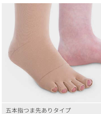
五本指つま先ありタイプ