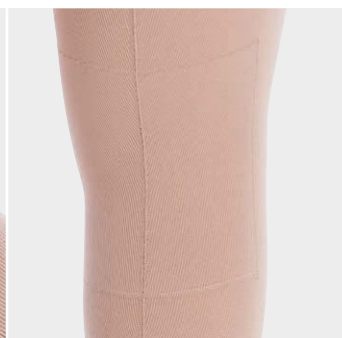
cE点のトリコット裏地