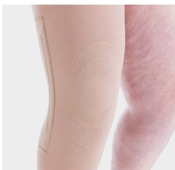
両側の膝サポート加工および／または膝蓋骨のサポートリング