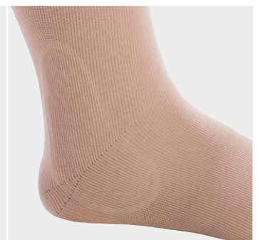
Dr. Rotter緩衝パッド（縫い込み）

・内果外果後部により圧迫が必要な場合 ・皮膚炎が見られる場合はシルバー入りのパッドもあります ・シリコン製パッドもあります