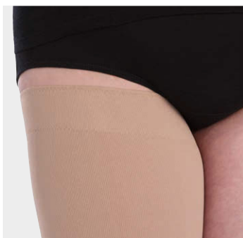
生地に縫い込んだシリコンすべり止め

・オーバーハイトとの併用のみで可 ・生地内側3/4のみ縫い込みも可能 ・その上に別のシリコンすべり止めを付けることもできる