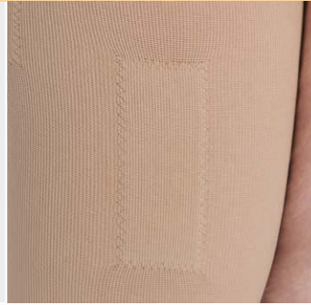
シリコンストッパー