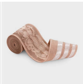
レースシリコンすべり止め 5 cm