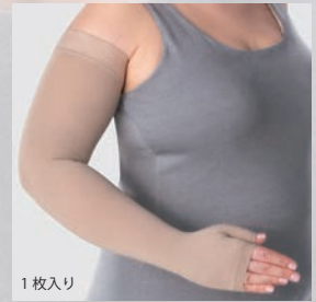
シームレス ミトン付き スリーブ