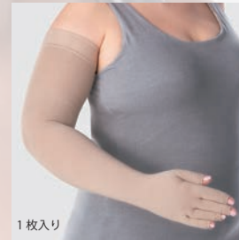
シームレス グローブ付き スリーブ